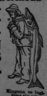
Ninguna emulsión iguala á esta marca.